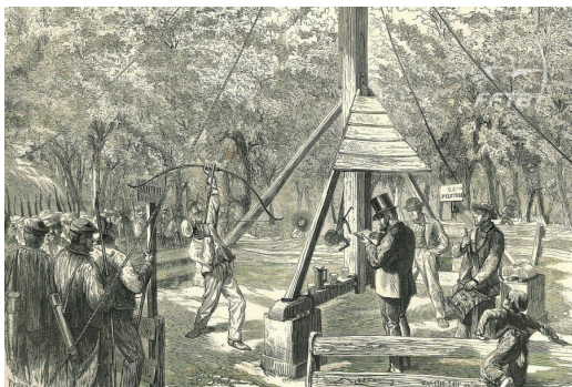
Extrait du journal L'ILLUSTRATION N°1628 du 04 avril 1874

Par ailleurs, il est d'usage de commencer la journée par un accueil chaleureux autour d'un café, chocolat chaud ou vin chaud, accompagné de brioches que le Roy de l'année précédente aura pris soin d'offrir. S'ensuit un salut aux buttes (lorsque c'est possible) accompagné d'un moment de silence drapeau baissé, partagé par tous les participants (archers et accompagnants). Les archers portent leur tenue de compagnie et les Officiers leur(s) écharpe(s).