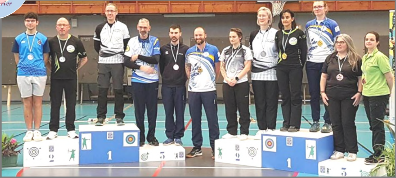
Championnat régional Seniors 1 arcs classiques et Seniors 2 arcs à poulies Les podiums - Arcs classiques Seniors 1 Dames et Hommes. - Arcs à poulies Seniors 2 Dames et Hommes