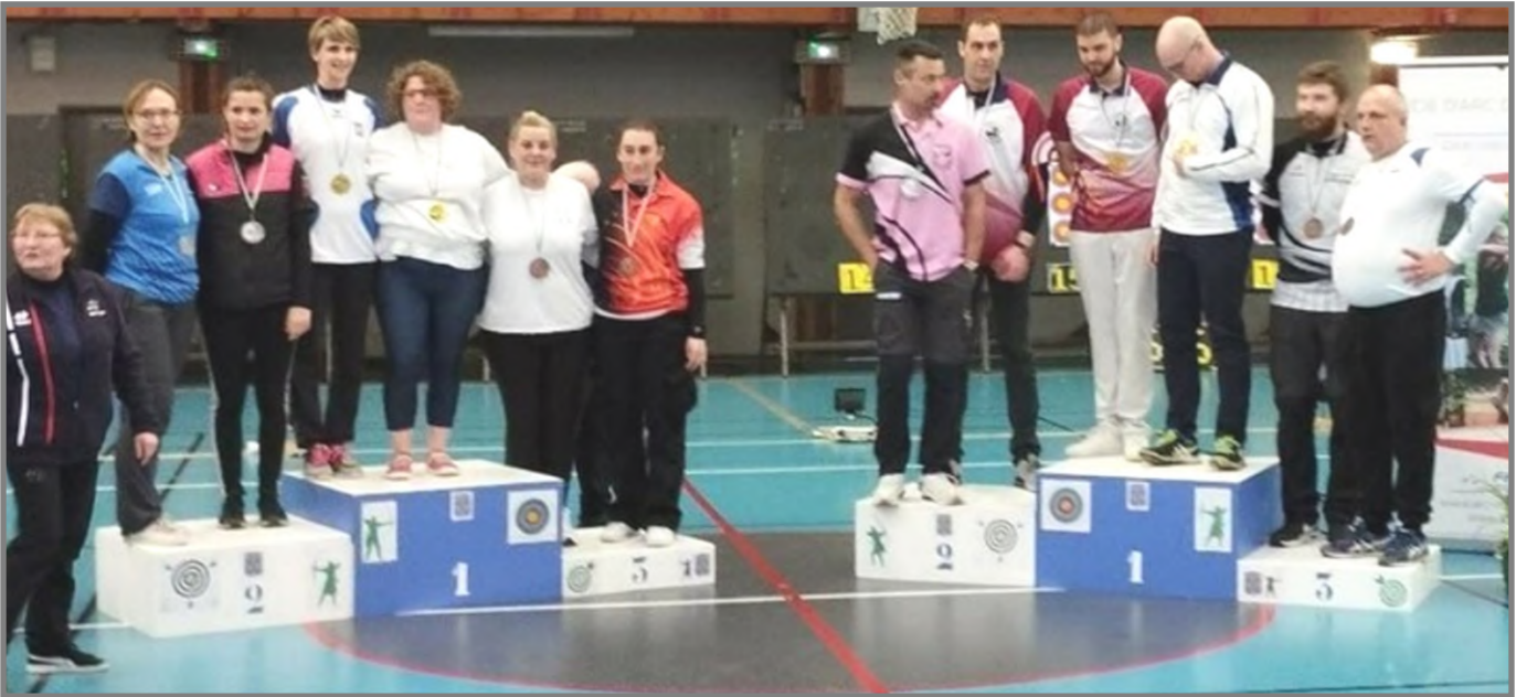
Championnat régional Seniors 1 arcs classiques et Seniors 2 arcs à poulies Les podiums - Arcs classiques Seniors 2 Dames et Hommes. - Arcs à poulies Seniors 1 Dames et Hommes