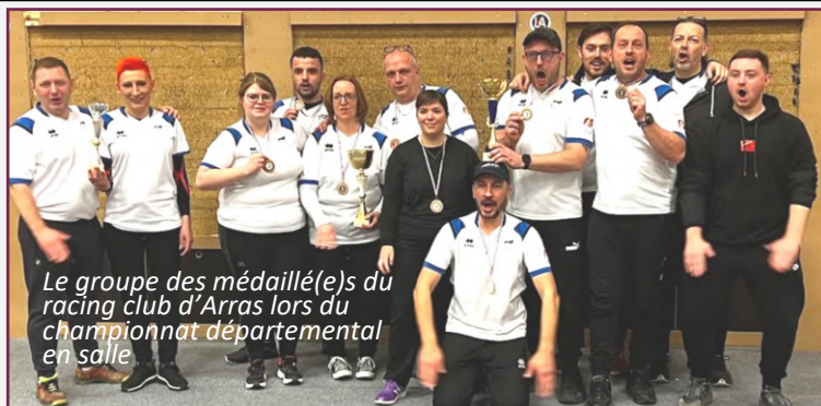
Le groupe des médaillé(e)s du racing club d'Arras lors du championnat départemental en salle

(2 groupes le mardi pour les jeunes, et 2 groupes le jeudi pour les adultes), les compétiteurs, et les tireurs loisir.