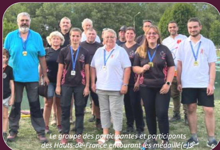
Le groupe des participantes et participants des Hauts-de-France entourant les médaillé(e)s